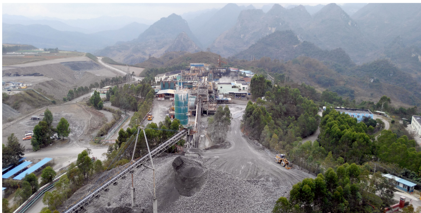
贵州锦丰矿业有限公司全景