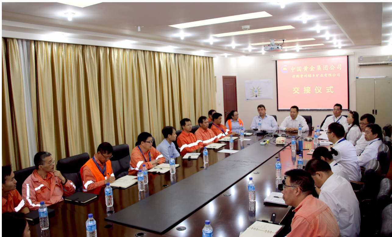
中国黄金集团公司收购贵州锦丰矿业有限公司交接仪式