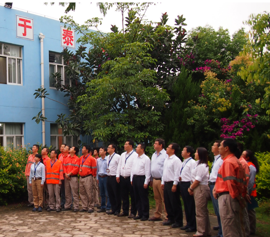
交割仪式上举行的升旗仪式（降加拿大国旗和埃尔拉多公司旗，升中国国旗和中国黄金公司旗，奏中国国歌）

路”建设中，我们必须严格执行新安全环保法，进一步做好安全生产和生态环境保护工作，以生态矿业、绿色发展新理念推进“一带一路”黄金产业创新，建设绿色矿山、和谐矿山。同时在海外开发过程中，要熟悉当地国的法律、政策，做好社区和谐建设和劳资关系建设。