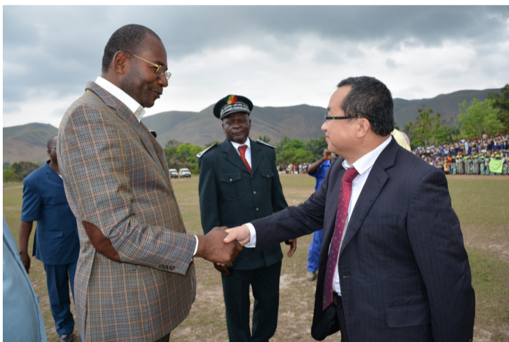
刚果（布）矿业署署长视察索瑞米项目